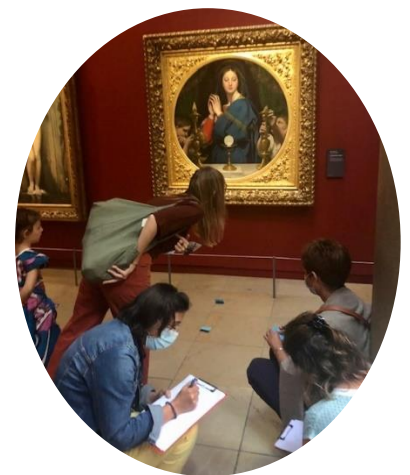
les stagiaires de la Promo 14