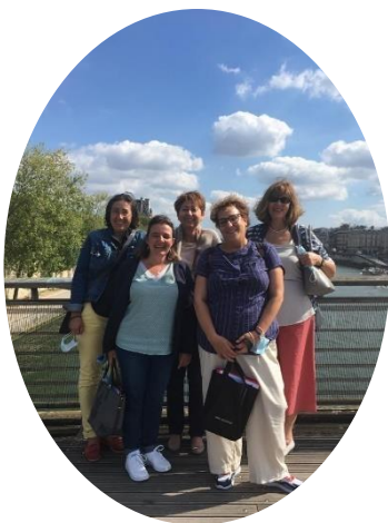
Visite au Musée d'Orsay avec