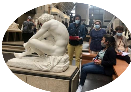
Collage réalisé par Annick TORRES, inspiré de la visite au musée